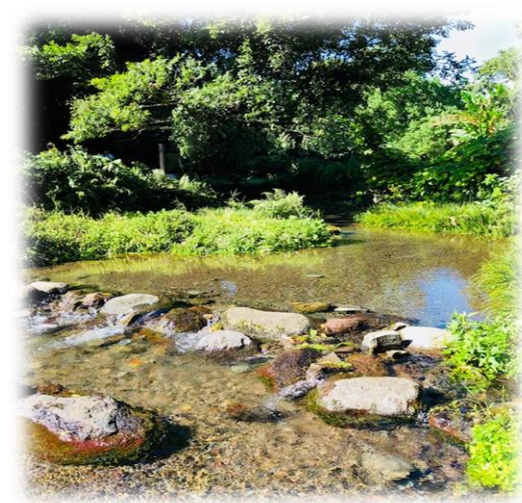
水前寺公園から江津湖へ流れる小川

患者さんの在宅生活を支え 病気予防・介護予防を 大事にしながら その人らしく生ききっていただく お手伝いをする