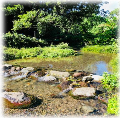
水前寺公園から江津湖へ流れる小川

患者さんの在宅生活を支え 病気予防・介護予防を 大事にしながら その人らしく生ききっていただく お手伝いをする